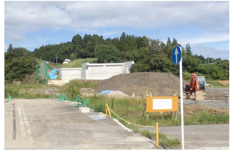
▲No.27から終点側を望む