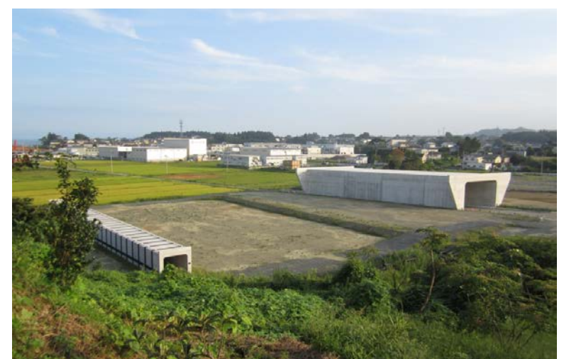
▲No.16付近から起点側を望む