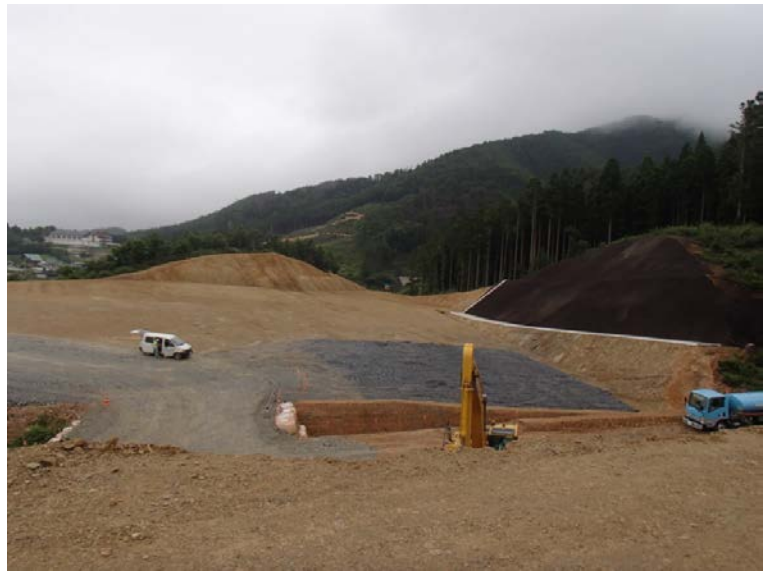
▲No.30から起点側を望む