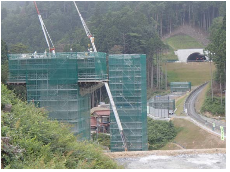
▲No.80から終点側を望む