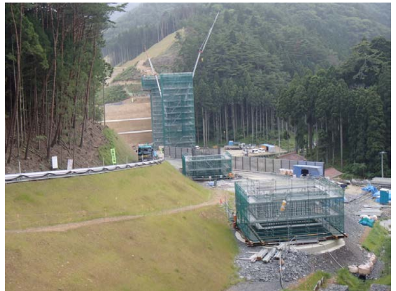
▲No.100から起点側を望む