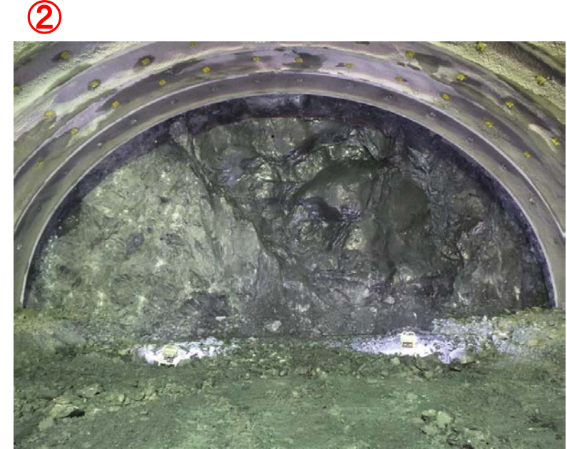
▲気仙沼第2号トンネル内切羽の状況を望む