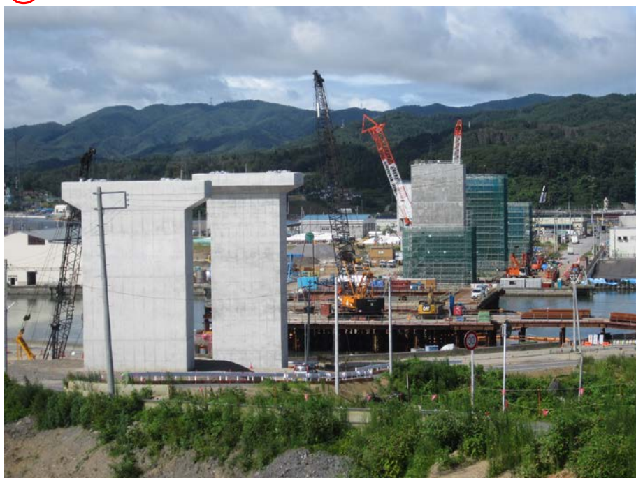
▲No.83付近から終点側を望む