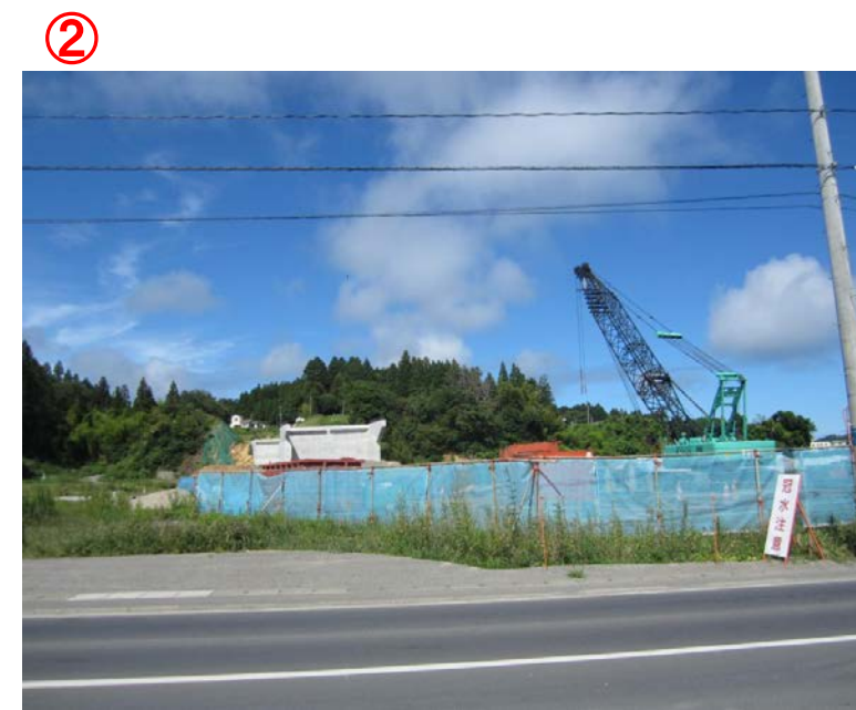
▲No.27から終点側を望む