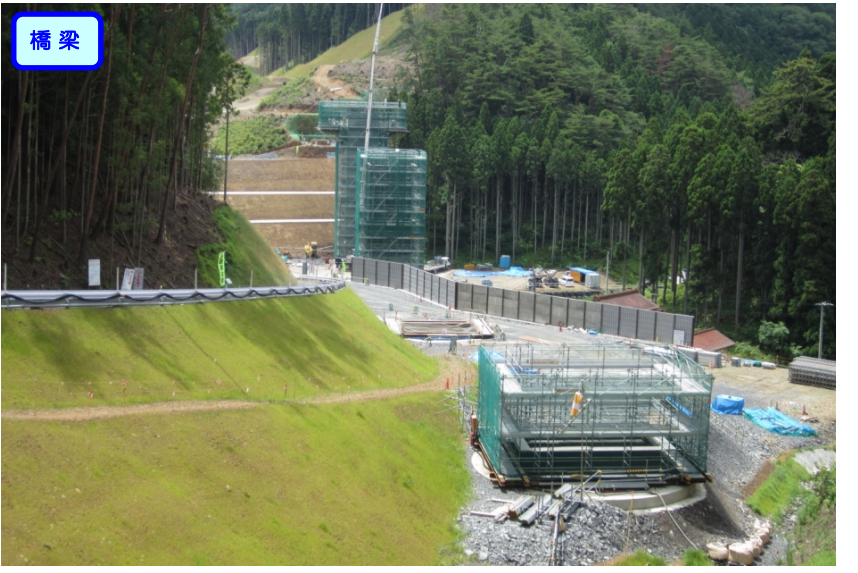
▲No.100から起点側を望む