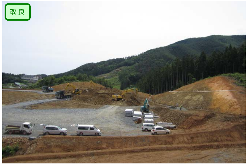
▲No.30から起点側を望む