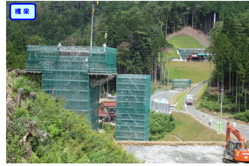
▲No.80から終点側を望む