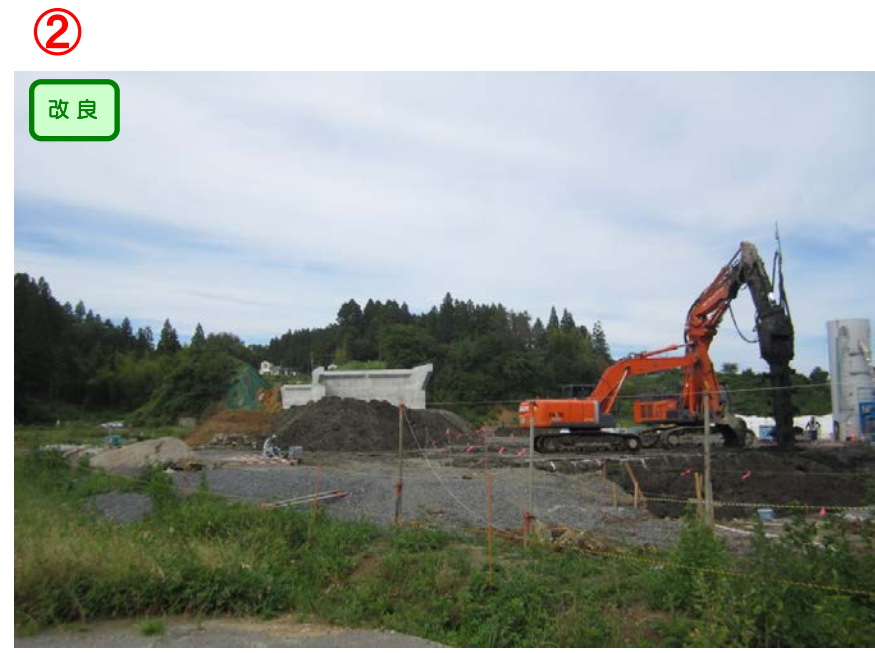
▲No.27から終点側を望む