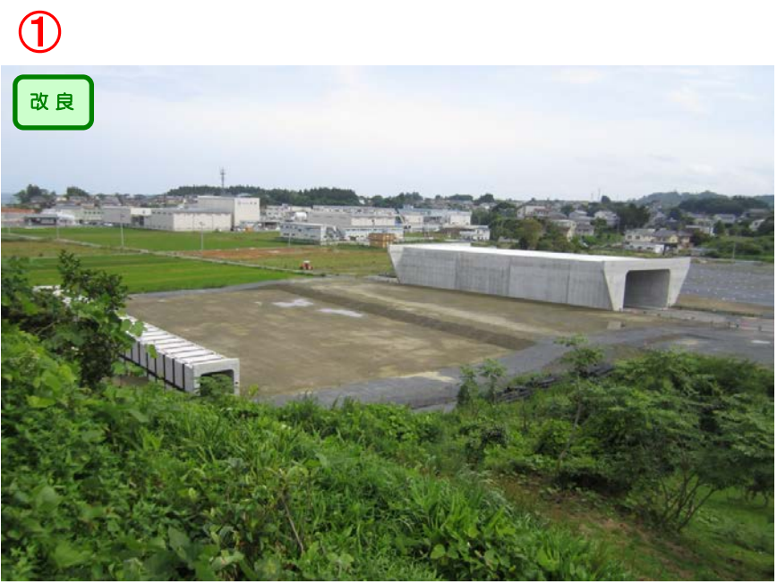
▲No.16付近から起点側を望む

松崎浦田地区道路改良工事 受注者:(株)小野良組 工期:H27.5.1～H28.9.30