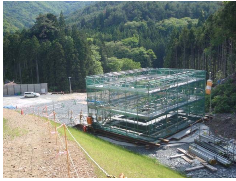
▲No.100から起点側を望む