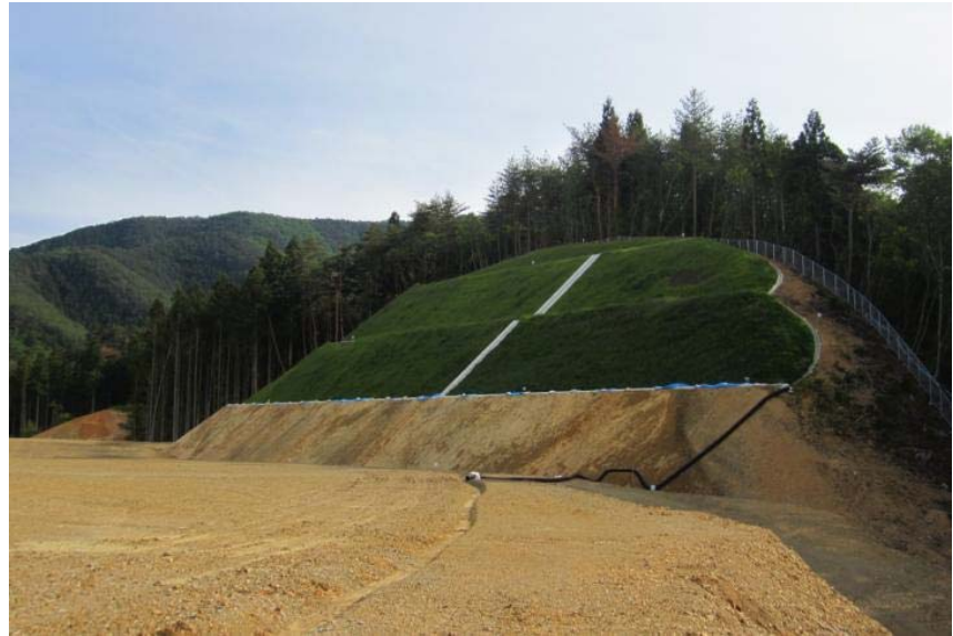
▲No.30から起点側を望む