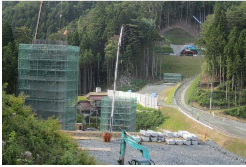
▲No.80から終点側を望む