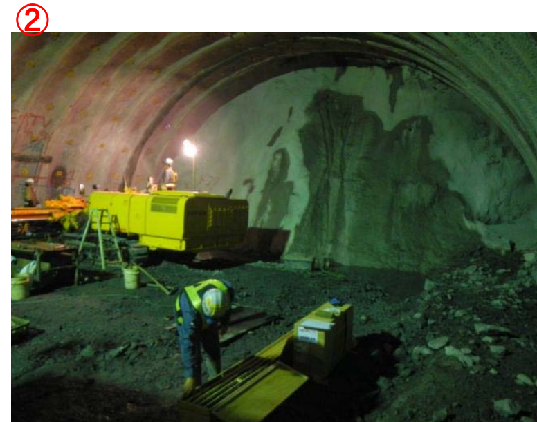
▲気仙沼第2号トンネル内切羽の状況を望む