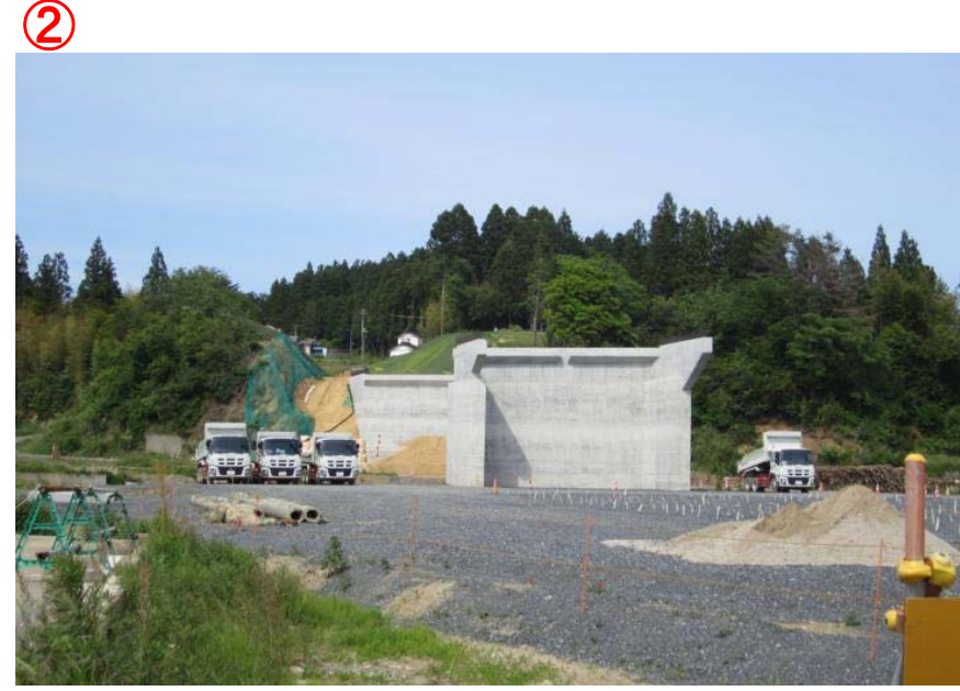
▲No.27から終点側を望む