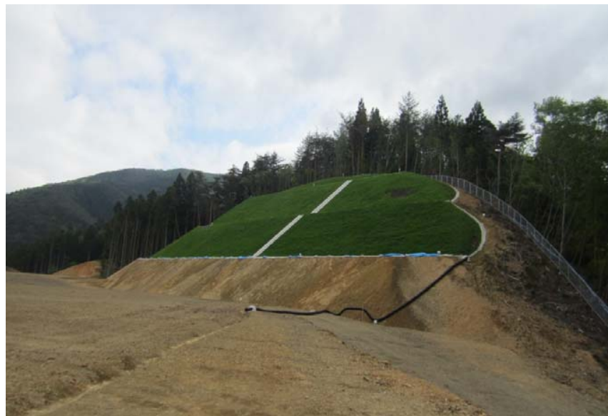
▲No.30から起点側を望む