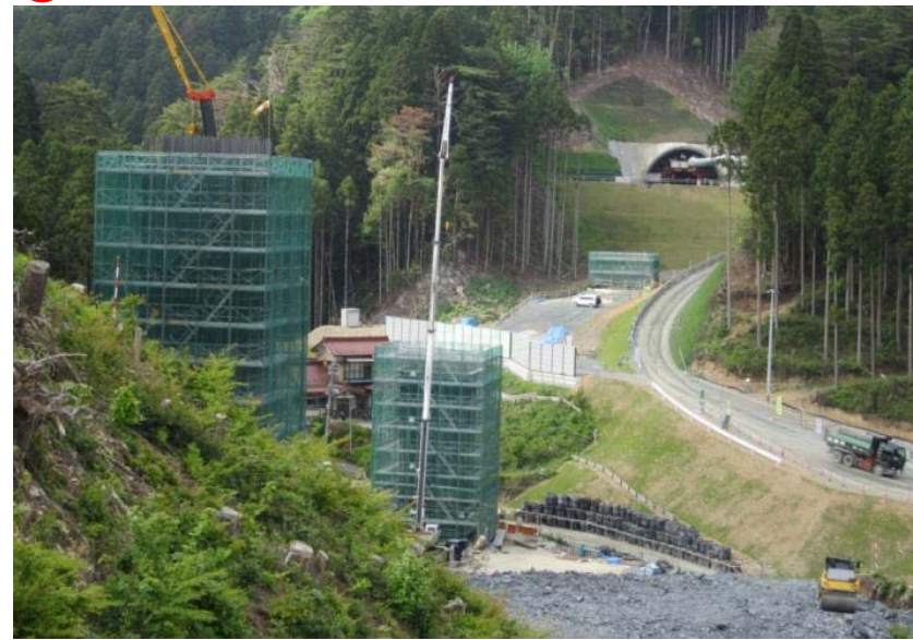
▲No.80から終点側を望む