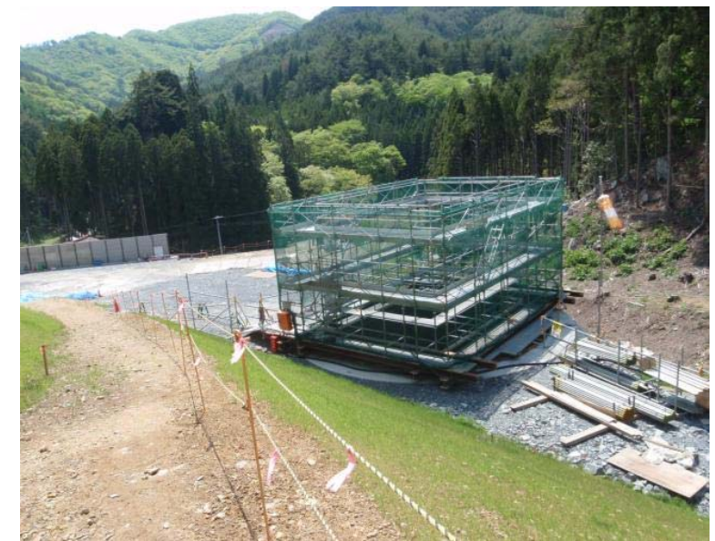
▲No.100から起点側を望む