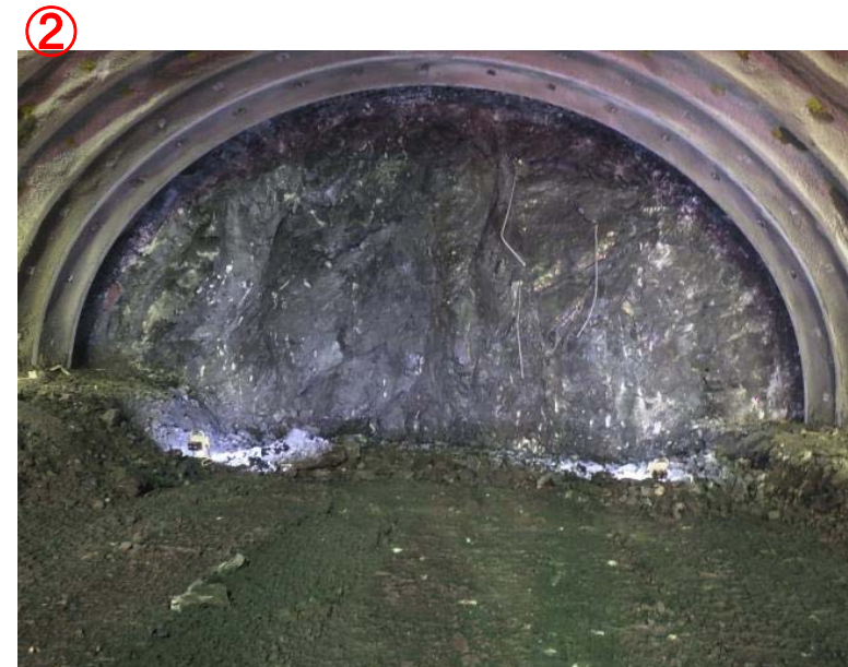
▲気仙沼第2号トンネル内切羽の状況を望む