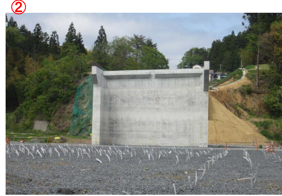
▲No.27から終点側を望む