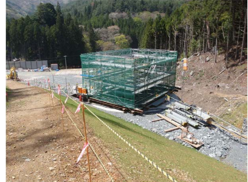
橋脚基礎施工状況