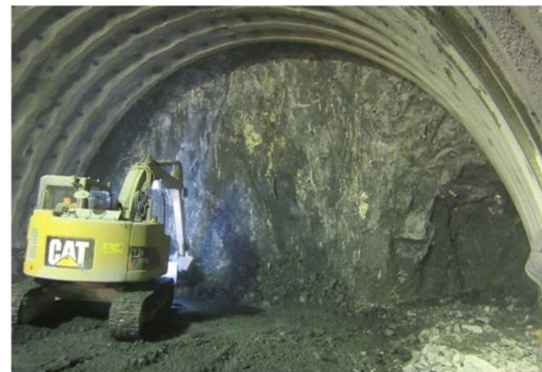
トンネル掘削状況