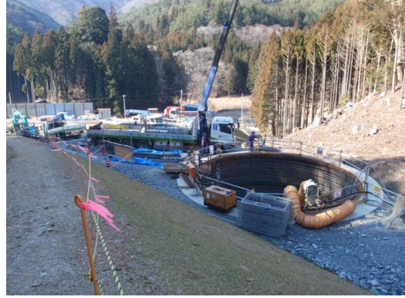
橋脚基礎施工状況