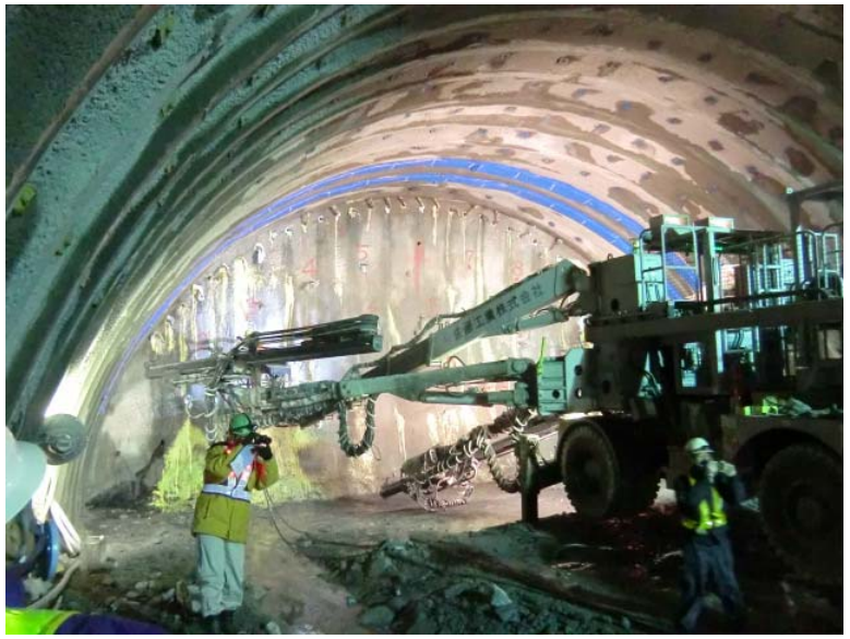
トンネル掘削状況