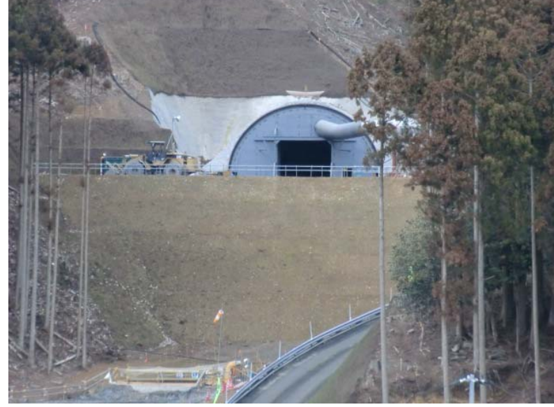
トンネル坑口状況