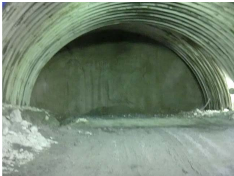
トンネル切羽状況