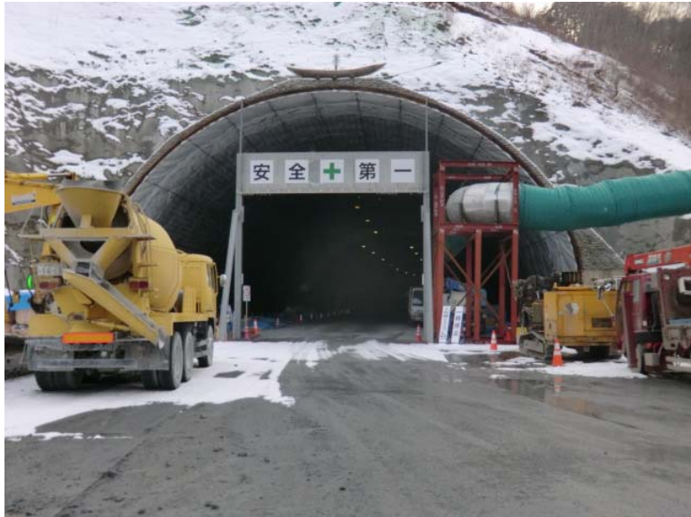
トンネル坑口状況