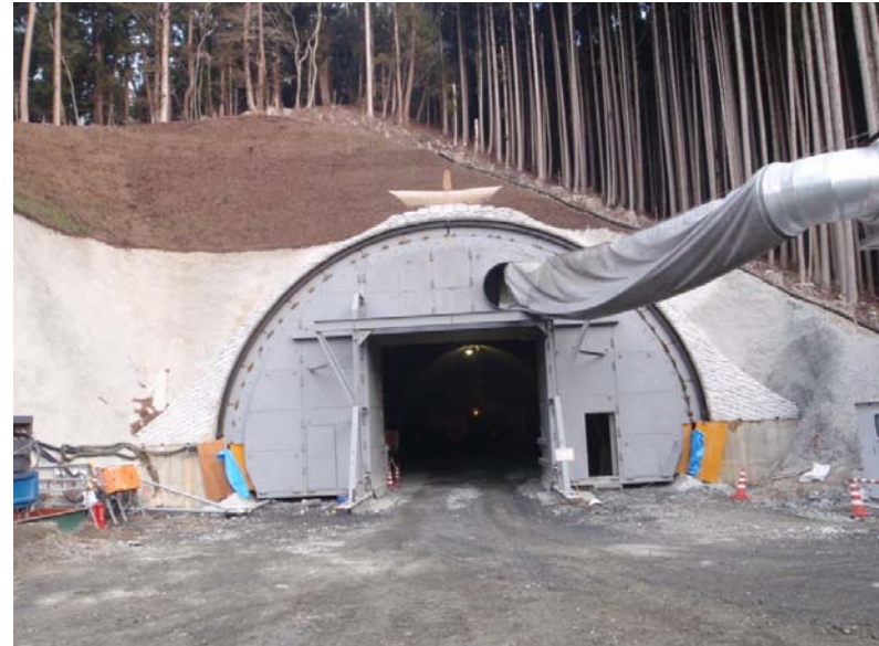
トンネル掘削状況