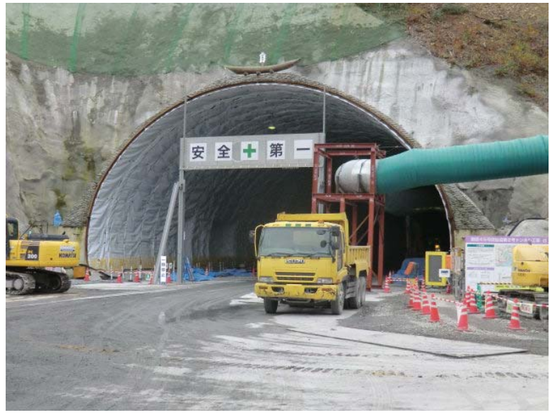
トンネル掘削状況