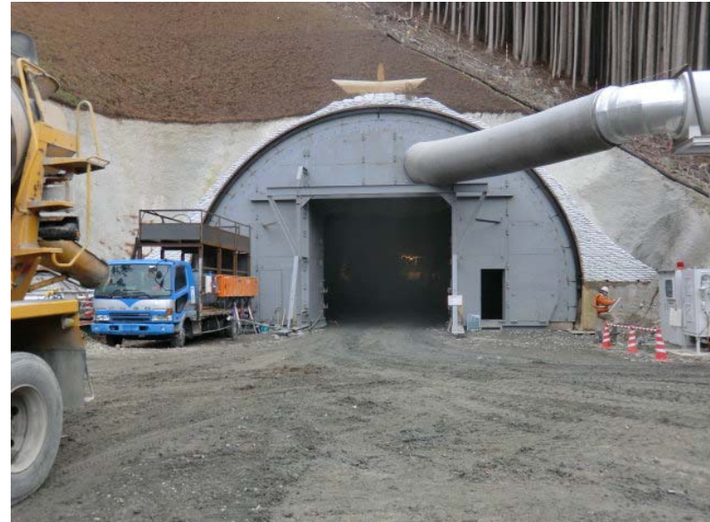
トンネル掘削状況