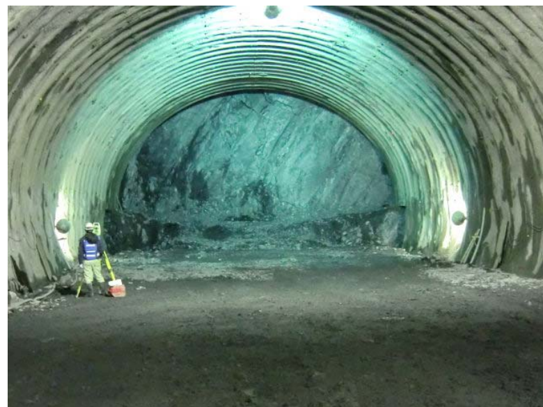
トンネル掘削状況