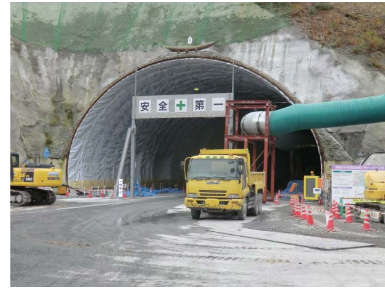
トンネル掘削状況