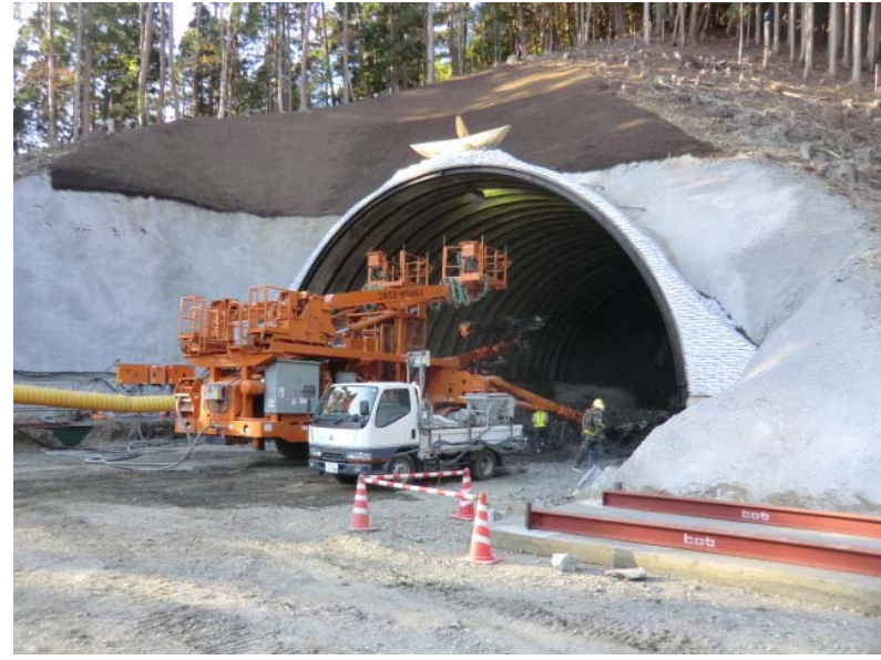
トンネル掘削状況