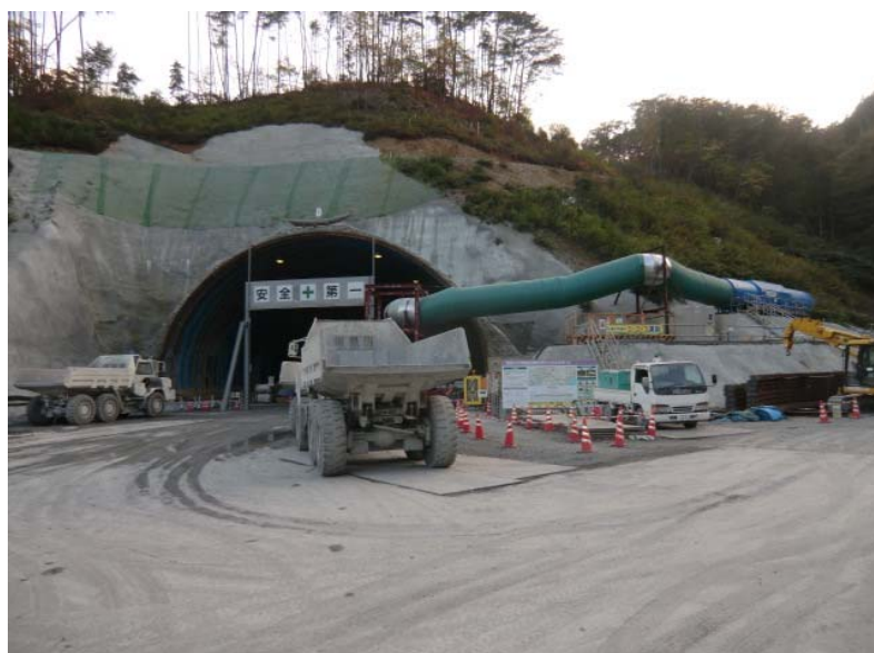
トンネル掘削状況