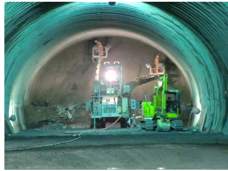
トンネル掘削状況