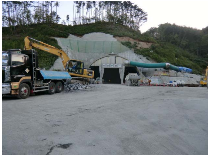
トンネル掘削状況