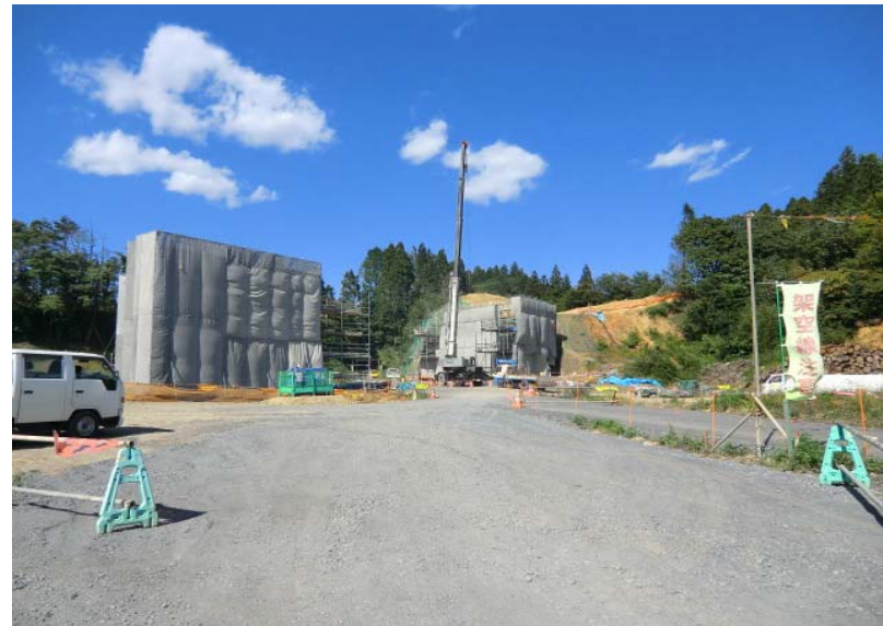
橋梁下部工構築状況