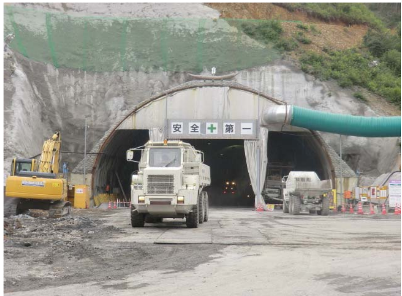
トンネル掘削状況