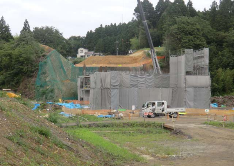
橋梁下部工構築状況