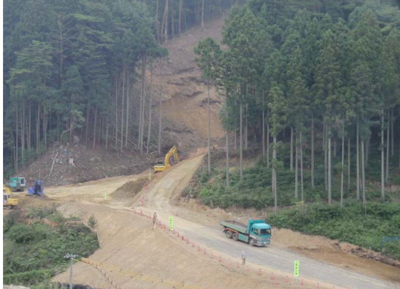
工事用道路造成状況