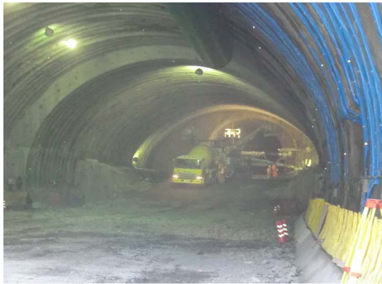
トンネル掘削状況