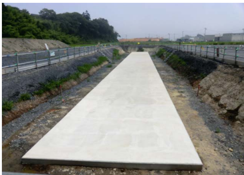
BOX基礎コンクリート施工状況