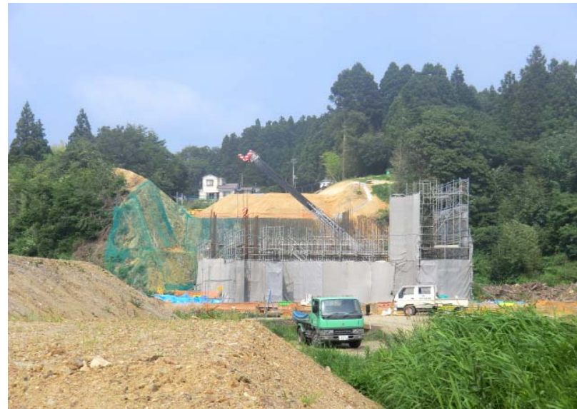
橋梁下部工鉄筋組立・切土状況