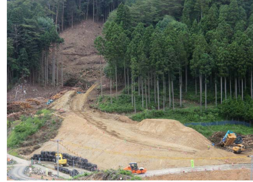
工事用道路造成状況