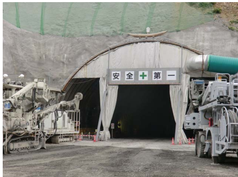
トンネル坑口状況