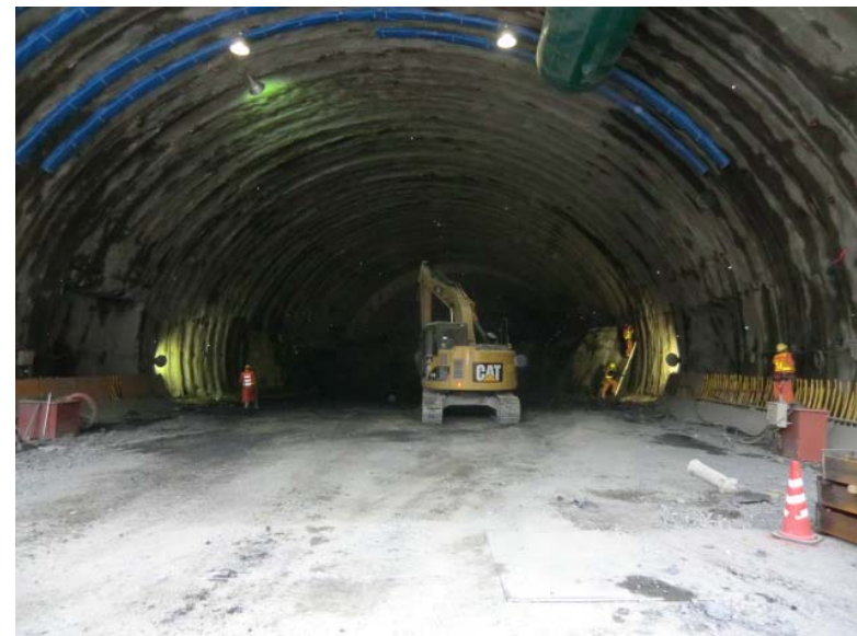
インバート施工状況