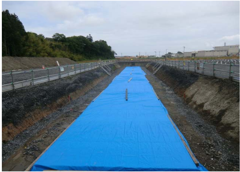
BOX基礎コンクリート施工状況