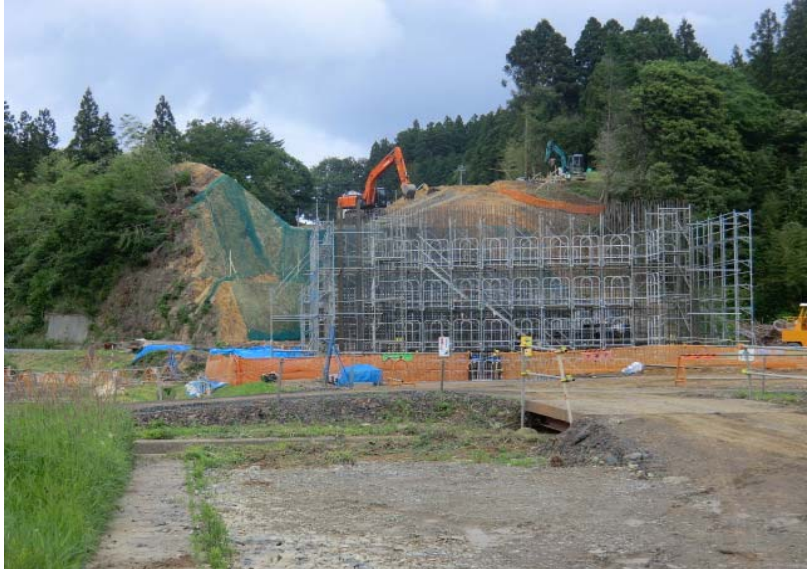
橋梁下部工鉄筋組立・切土状況