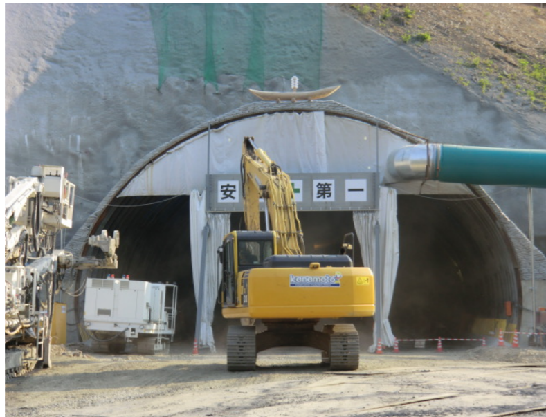
トンネル坑口状況