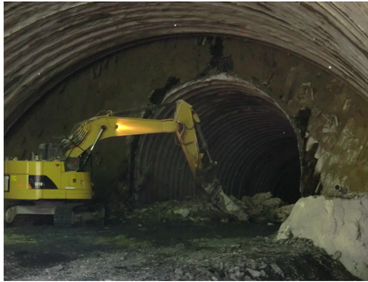
トンネル切羽状況