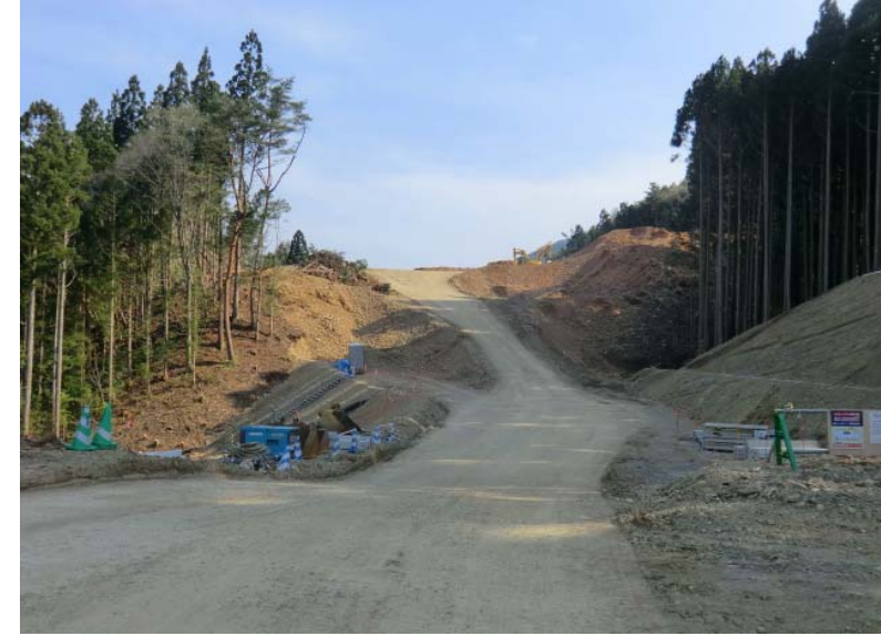
立木伐採・進入路造成状況