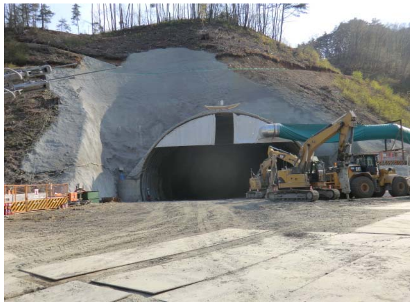
トンネル坑口状況