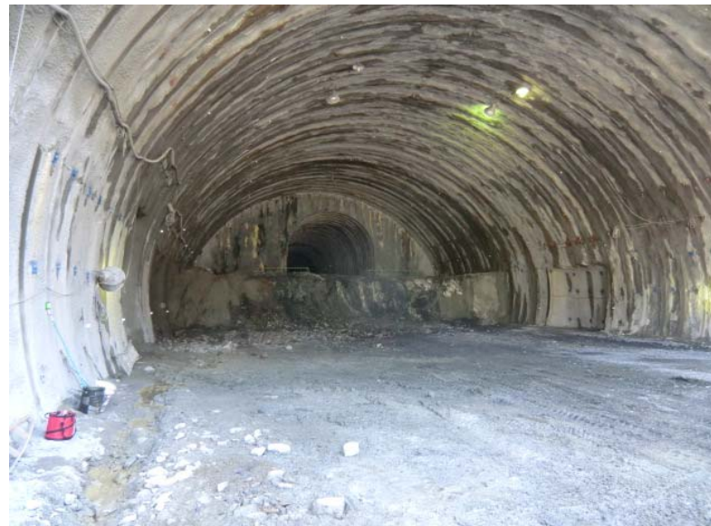
トンネル切羽状況