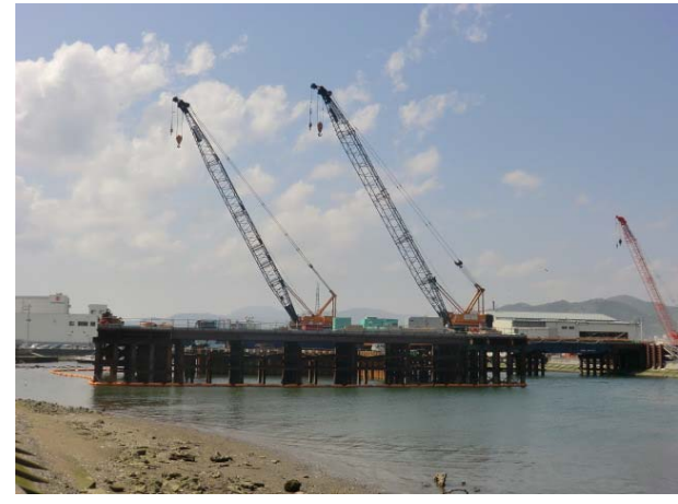
仮設構台施工状況