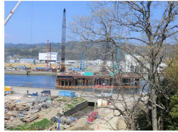
仮設構台施工状況