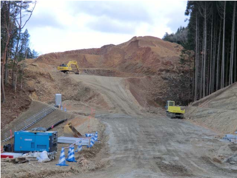
立木伐採・進入路造成状況