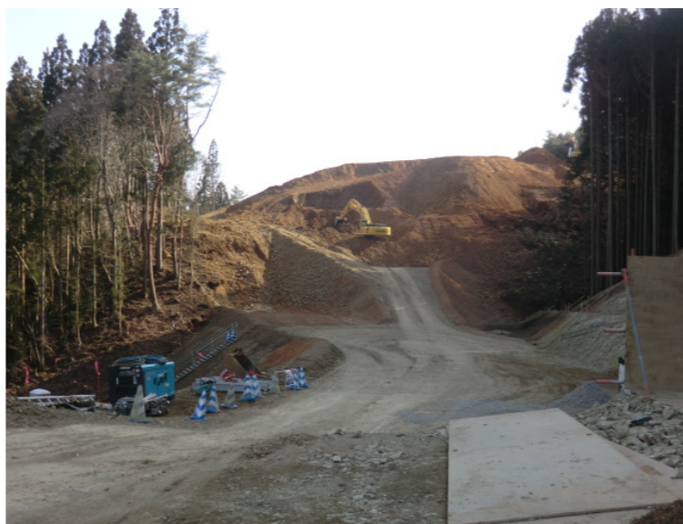
立木伐採・進入路造成状況