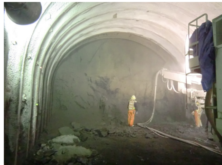
トンネル掘削状況