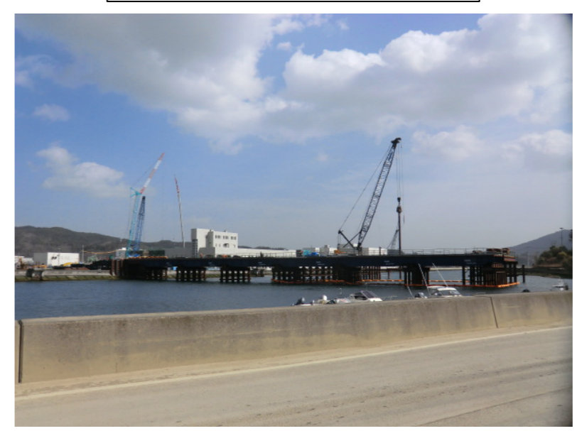
仮設構台施工状況