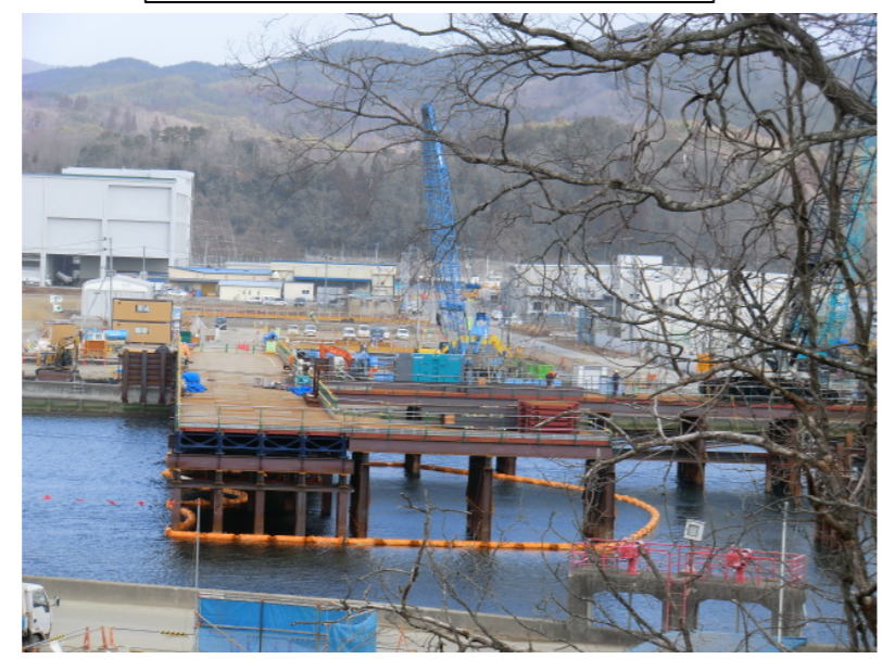
仮設構台施工状況