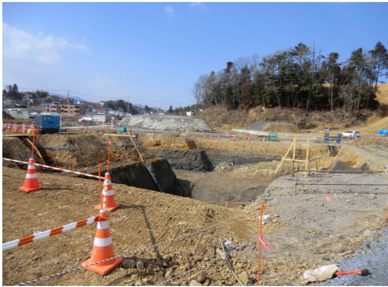
橋台床掘準備状況