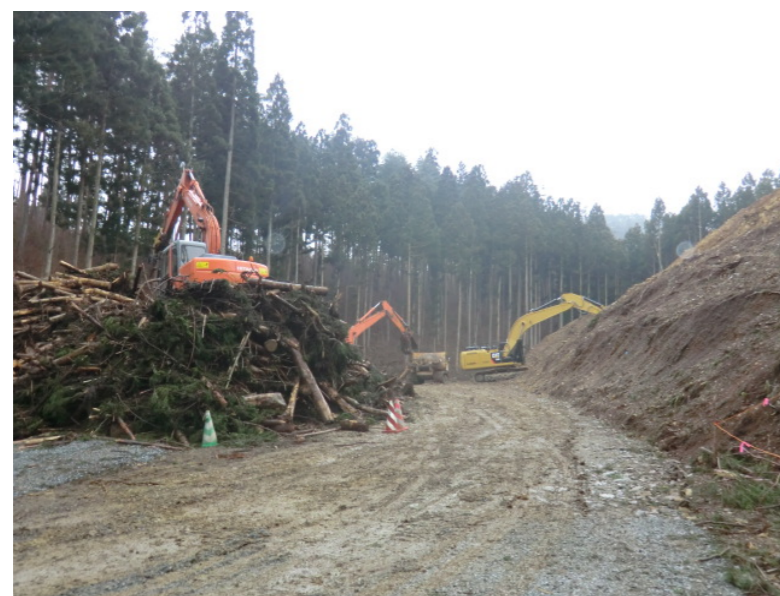
立木伐採・進入路造成状況