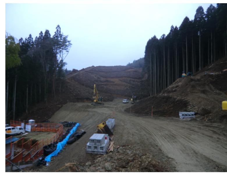
立木伐採・進入路造成状況