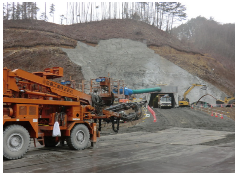
トンネル掘削状況