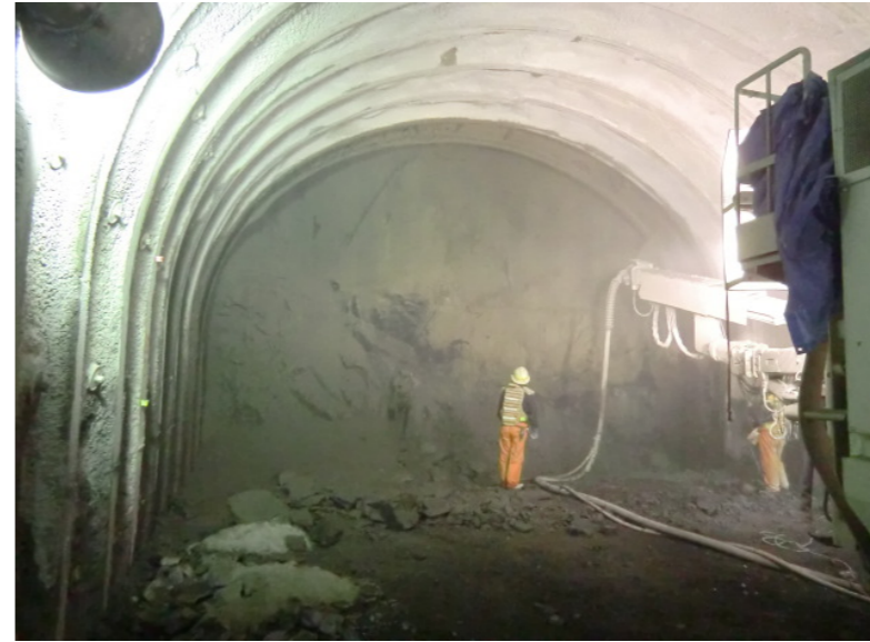
トンネル掘削状況