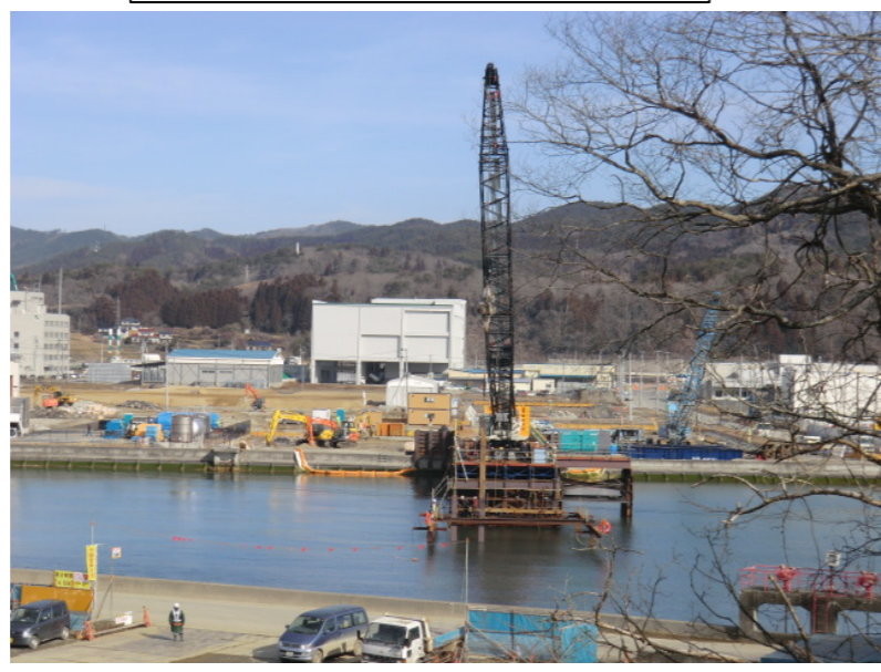
仮設構台施工状況