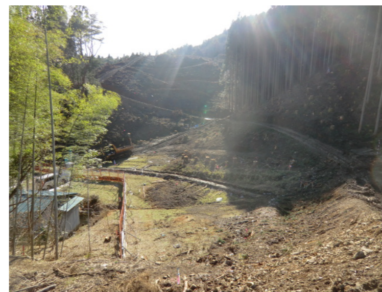
立木伐採・進入路造成状況