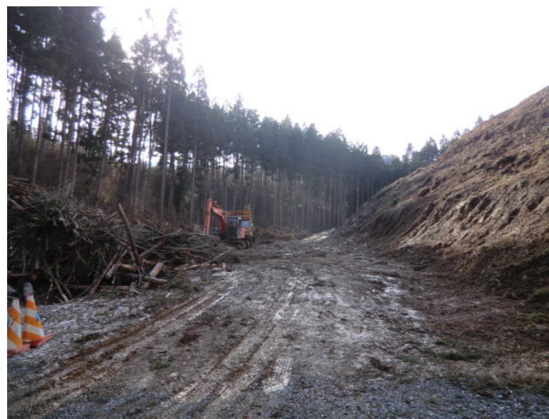
立木伐採・進入路造成状況