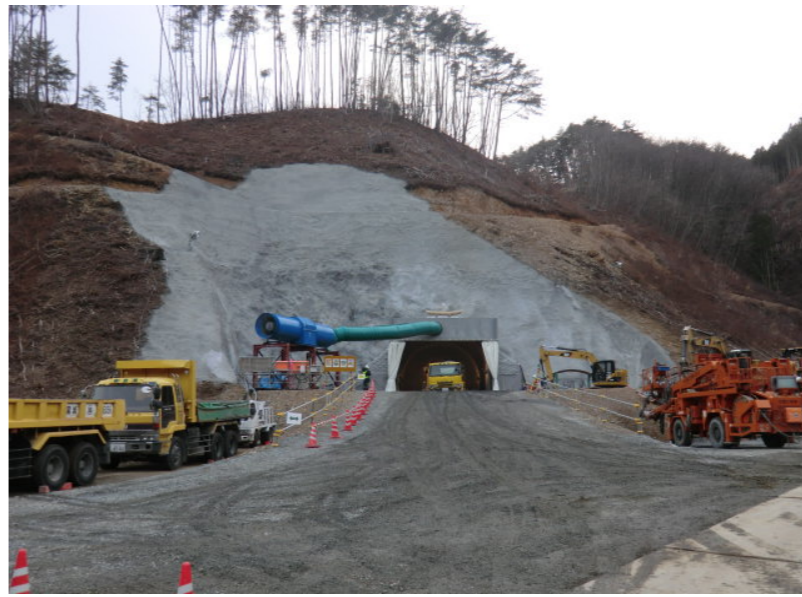
トンネル坑口付状況