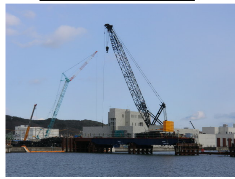
仮設構台施工状況