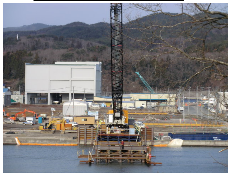
仮設構台施工状況